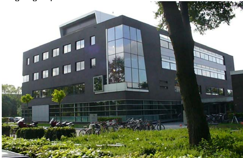
Figuur 1: Huidige Hubrecht Instituut Uithof, 2000

Het Hubrecht Instituut werd gesticht in 1916 en is sinds 1917 een Instituut van de Koninklijke Nederlandse Akademie van Wetenschappen (KNAW) (KNAW,2013). Aanvankelijk was het Hubrecht gelokaliseerd in het centrum van Utrecht en had het als onderzoekfocus de embryologie. In de jaren zestig verhuisde het Hubrecht Instituut met de Universiteit Utrecht mee naar de Uithof waar de focus werd verlegd naar de moleculaire basis van embryonale ontwikkeling. Na de nieuwbouw eind 2000 heeft het Hubrecht Instituut zich toegelegd op fundamenteel stamcelonderzoek.